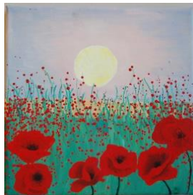
Öl auf Leinwand