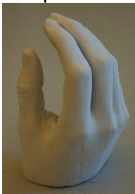
Hand aus Gips